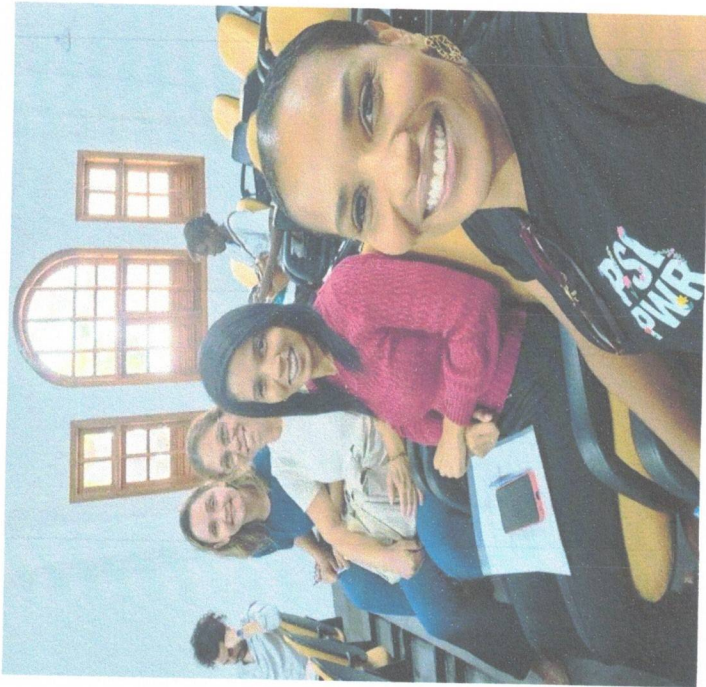
Reunião CMDCA – 03/02/2026