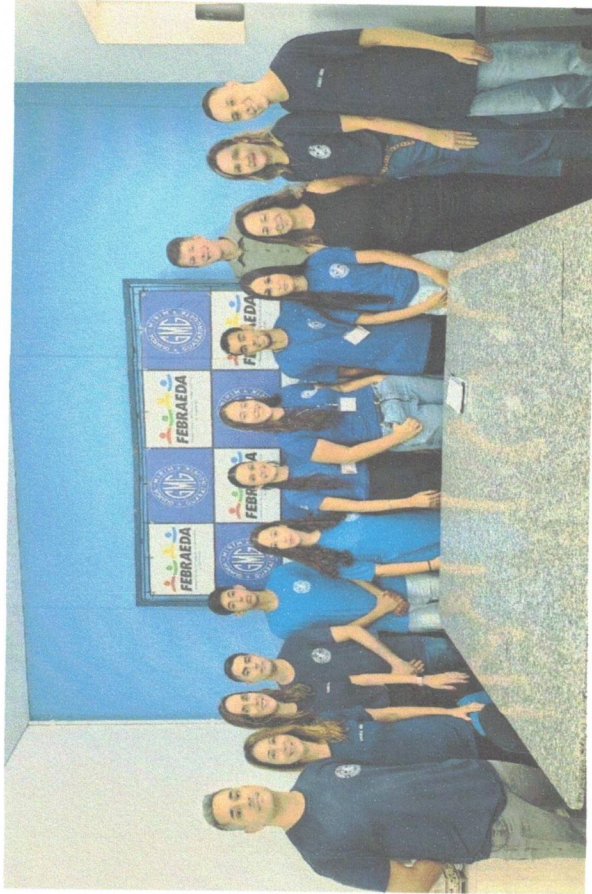
Reunião CPAA – 03/02/2026