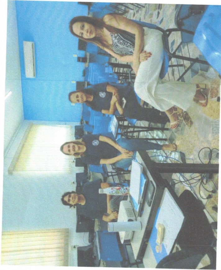
Reunião com os educadores – 13/02/2026