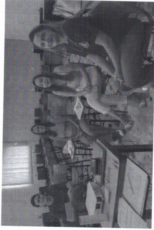
Reunião de educadores - 16/01/2026