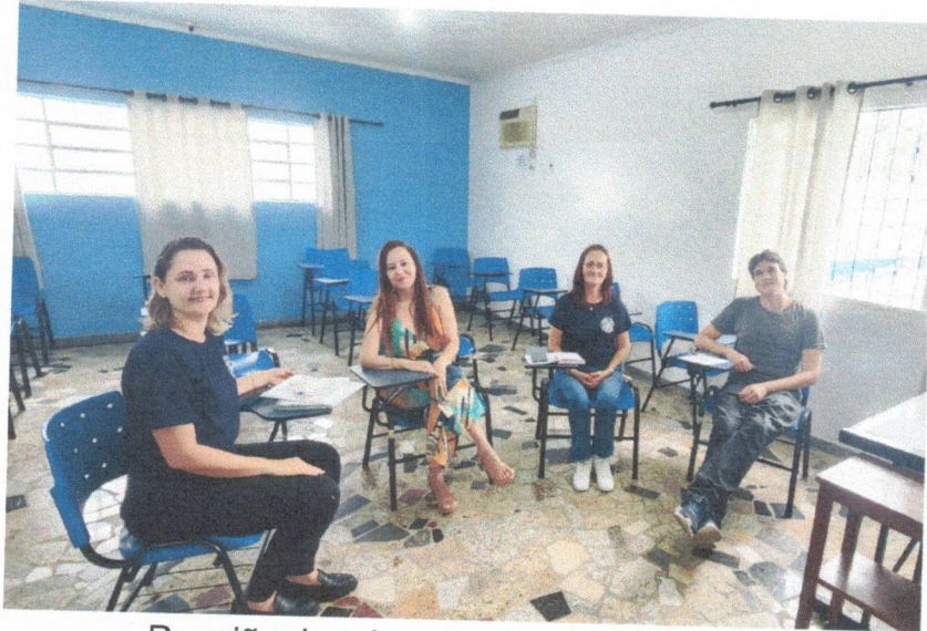
Reunião de educadores – 14/11/2025