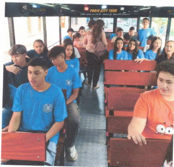
Socialização e Convivência – 14/11/2025 (FLIG)