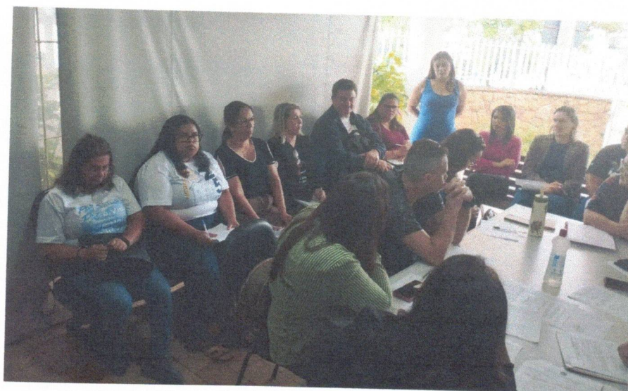
Reunião CMAS – 11/11/2025