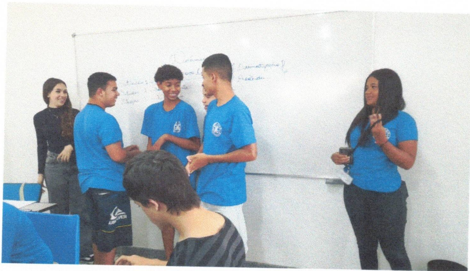
Protagonismo e Liderança – 10/11/2025