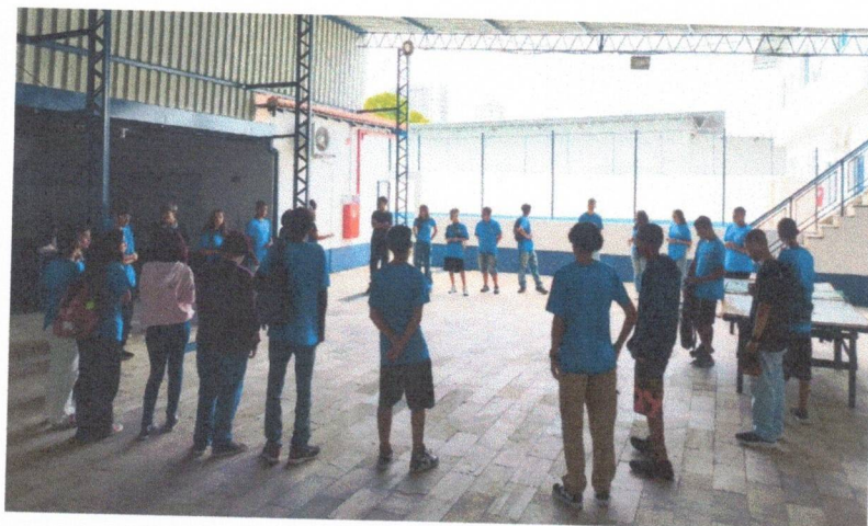
Acolhida - 24/11/2025