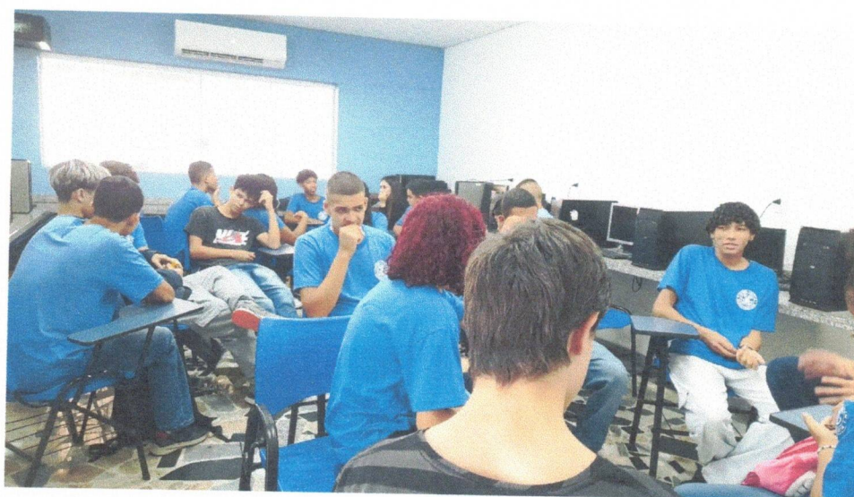
Gerar + - 10/11/2025