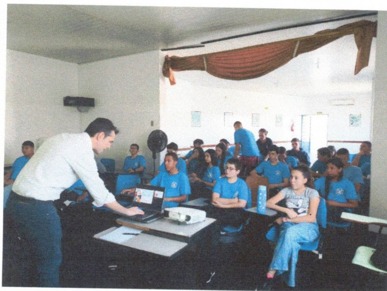
Socialização e Convivência : 07/11/2025 (palestra: Ética Digital)