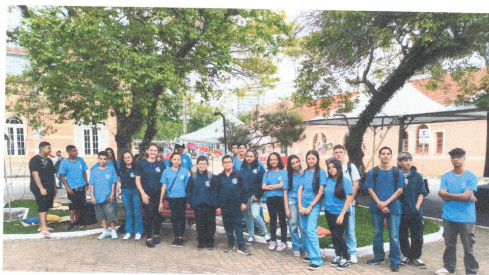
Socialização e Convivência - 14/11/2025 (FLIG)