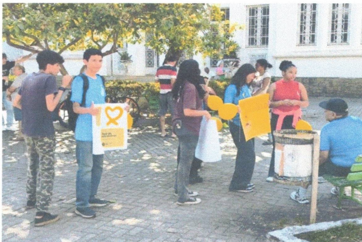
Protagonismo e Liderança – 29/09/2025 (Setembro Amarelo)