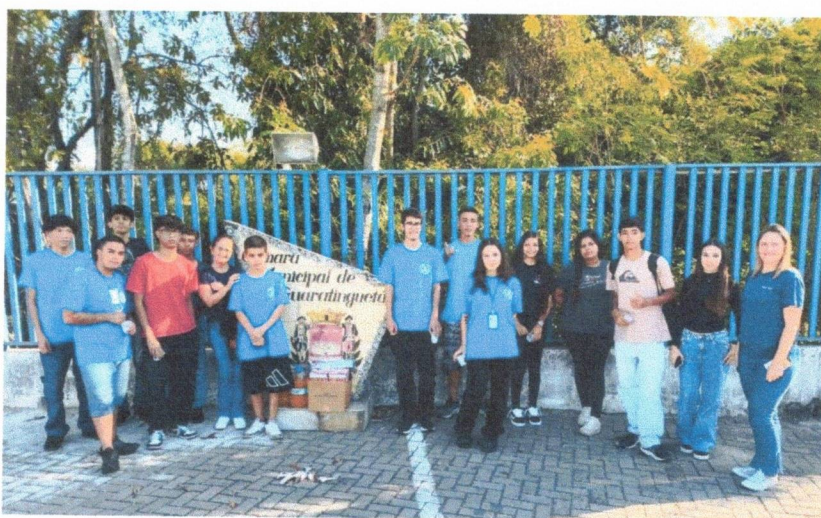
Cidadania: Direitos e Deveres – 12/09/2025 (Câmara Municipal)