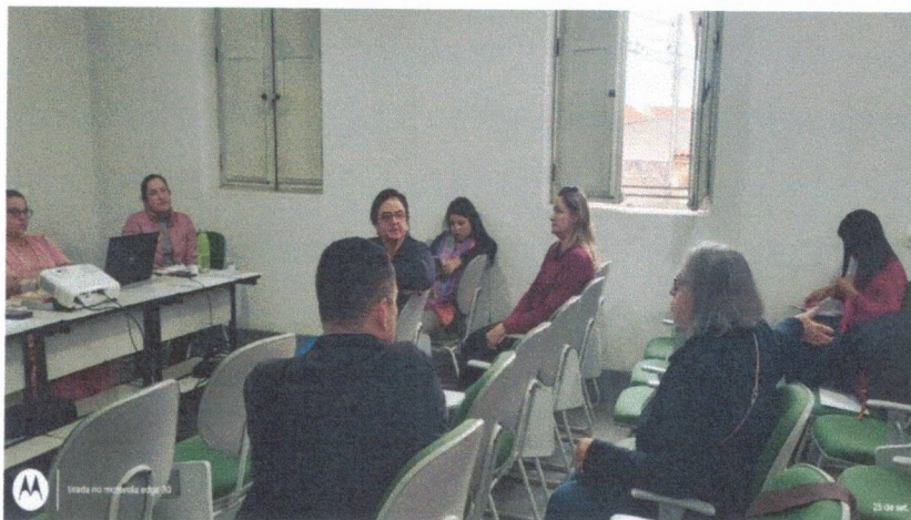
Reunião CMDCA – 25/09/2025