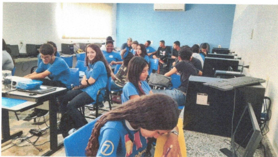
Protagonismo e Liderança – 05/09/2025