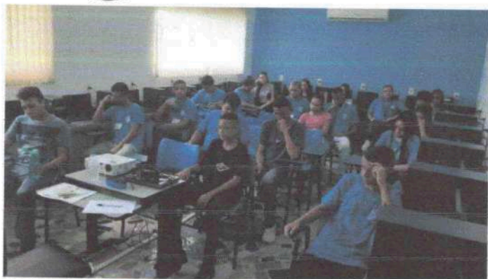
Oficina Habilidades e Competências 15/01/24