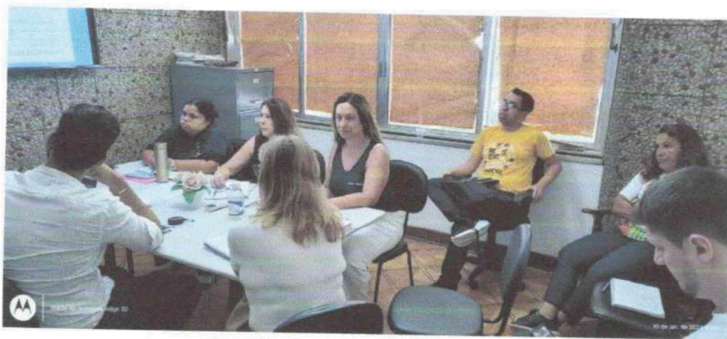
Reunião SMAS – 10/01/2024