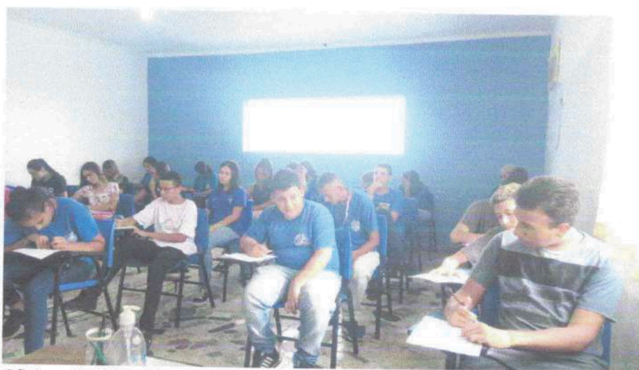
Oficina: Habilidades e Competências 08/01/2024