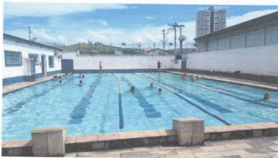
Socialização e Convivência – 19/01/24