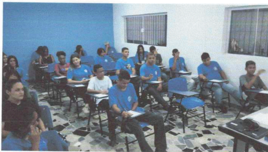
Oficina Caminhos para Crer-Ser - 08/01/24