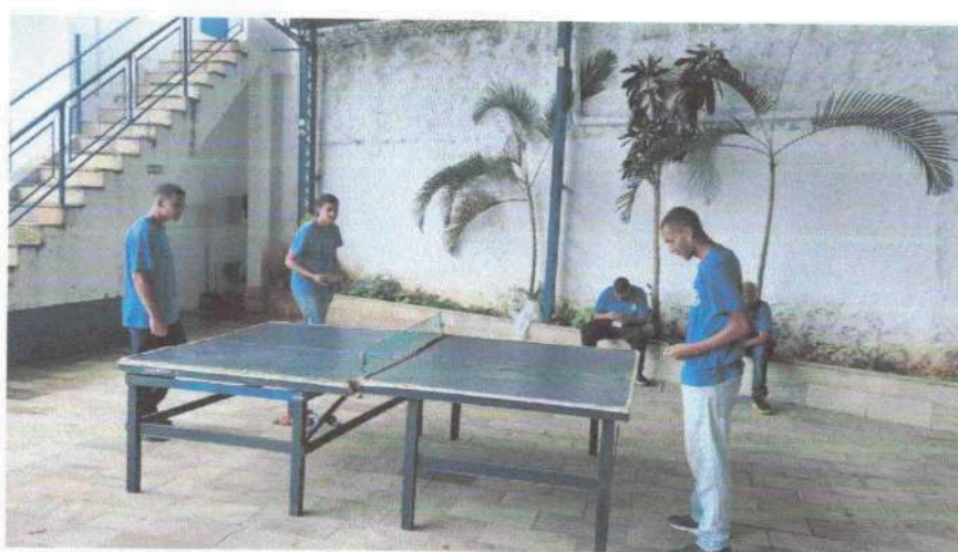
Oficina Socialização e Convivência - 26/01/24