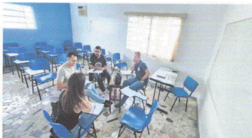
Reunião de Planejamento: 26/01/2024