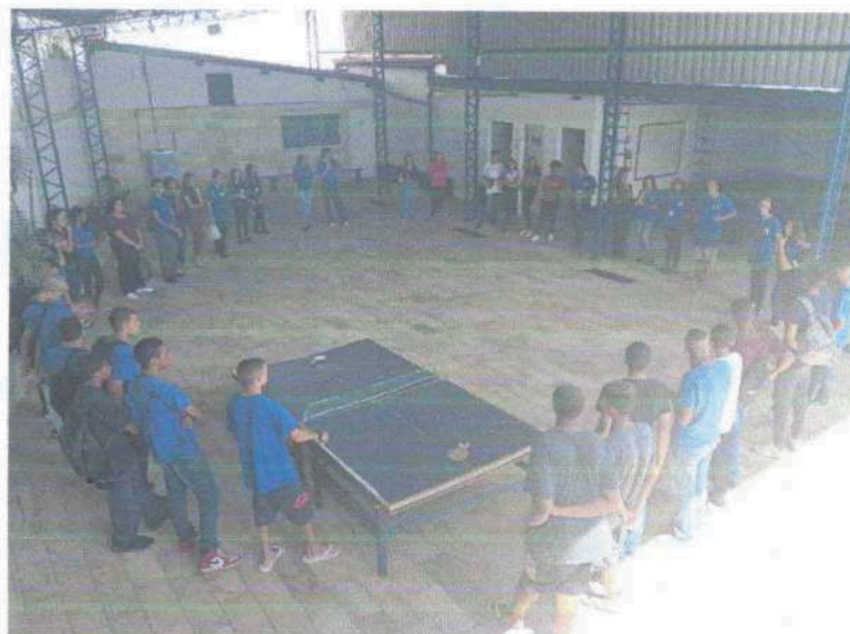
Acolhida – 26/01/2024

Prevenir a ocorrência de riscos sociais, seu agravamento ou reincidência.