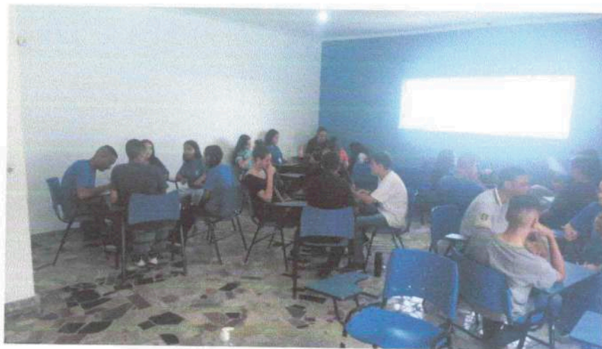
Habilidades e Competências – 15/01/24